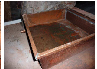
Auffangbecken unter dem perforierten Gurtboden

Da ein wesentlicher Teil der Kosten die Gerüstkos- ten sind, empfiehlt es sich, auch den benachbarten östlichen Turmschaft mit zu sanieren. Bei gleichzei- tiger Bearbeitung reduzieren sich diese Kosten er- heblich. Kostenberechnung südlicher und östlicher Turmschaft zusammen: 560.000 € . Der Glo- ckenstuhl (8.000 €) und die Haustechnik und Zuganker im Dachraum (36.000 €) haben eben- falls eine hohe Priorität, um Substanzverlust zu vermeiden.