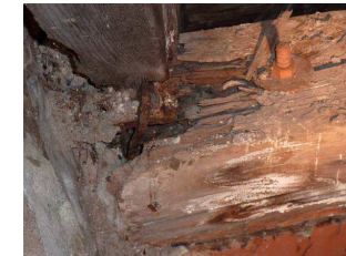
Nasssäule an der Fußpfette