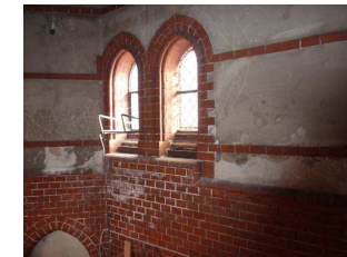
Chortreppenhaus Ost mit Feuchtigkeitsschäden

Da ein wesentlicher Teil der Kosten die Gerüstkos- ten sind, empfiehlt es sich, auch den benachbarten östlichen Turmschaft mit zu sanieren. Bei gleichzei- tiger Bearbeitung reduzieren sich diese Kosten er- heblich. Kostenberechnung südlicher und östlicher Turmschaft zusammen: 560.000 € . Der Glo- ckenstuhl (8.000 €) und die Haustechnik und Zuganker im Dachraum (36.000 €) haben eben- falls eine hohe Priorität, um Substanzverlust zu vermeiden.